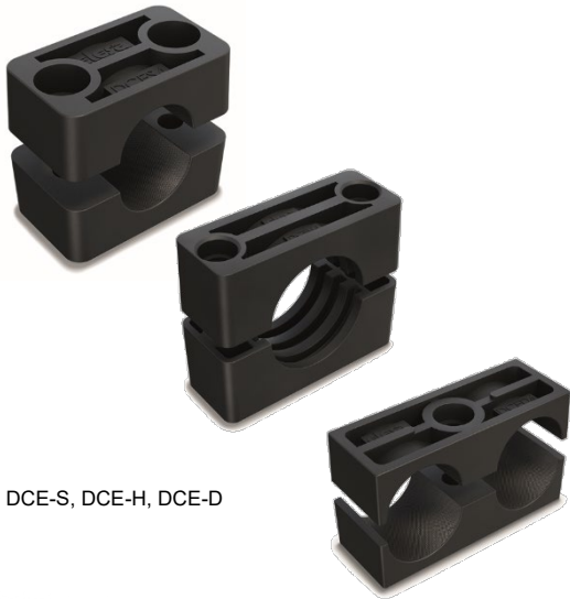
DCE-S, DCE-H, DCE-D